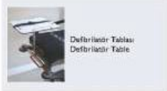
Defibrilator Tablası Defibrillator Table