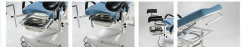
Ayarlanabilir Baldır Destek Aparatı Adjustable Leg Stirrups