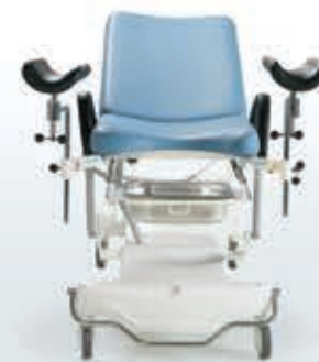
Paslanmaz Atık Toplama Küveti Stainless Steel, Removable Basin